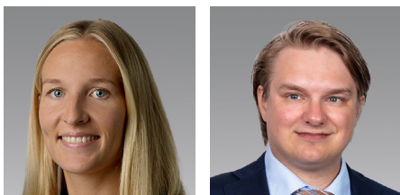
Siden er utarbeidet av skatterådgiverne Synne Hurum Austmo og Bernhard Henriksen Nicolaysen, begge Deloitte Advokatfirma.