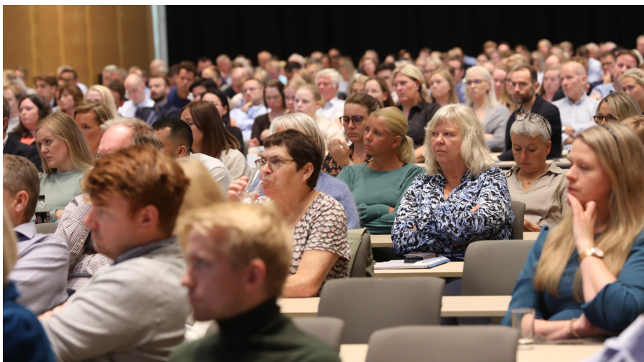
Rekordstor deltakelse på årets DnR-konferanse.