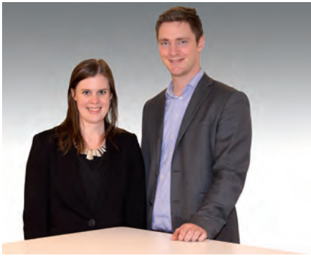
Sidene er utarbeidet av advokatfullmektig Inger Camilla Gjeruldsen og advokat Morten Rivefsrud, begge Deloitte Advokatfirma AS