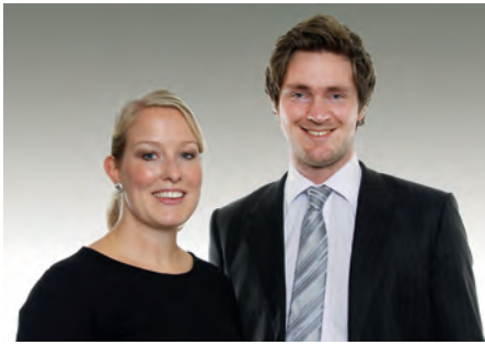
Sidene er utarbeidet av advokatfullmektigene Linda Hjelvik Amsrud og Morten Rivelesrud, begge Deloitte Advokatfirma AS.