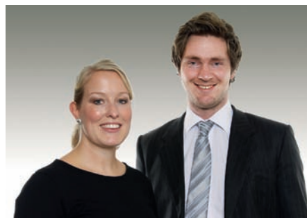
Sidene er utarbeidet av advokatfullmektigene Linda Hjelvik Amsrud og Morten Riveksrud, begge Deloitte Advokatfirma AS.