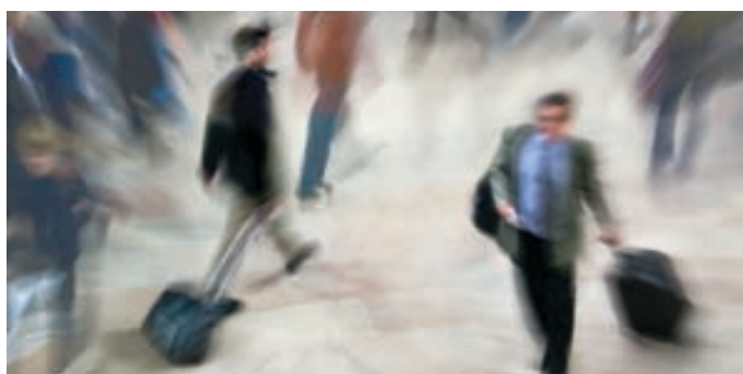
NOE NYTT: Når revisor skifter jobb, gjør han gjerne det for å prøve noe nytt.