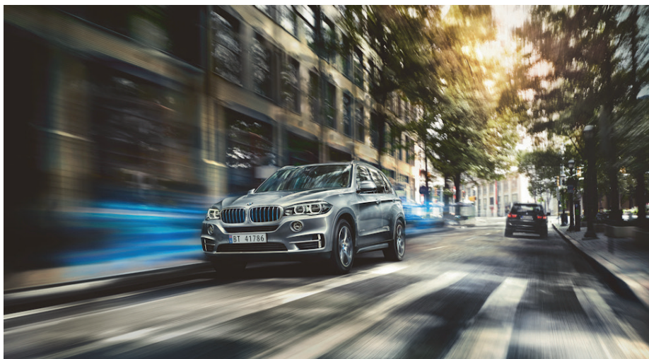
Hva med en BMW plug-in hybrid? Da må du være rask, fra 1. juli øker avgiftene.

BMW har godt med biler på lager (plug-in hybrider) for rask levering! Ta kontakt med din lokale BMW-forhandler for å få tilbud på ny bil før ferien!