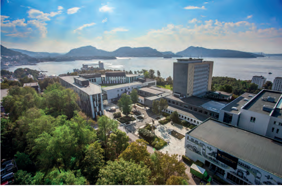
Våren 2018 starter NHH et helt nytt kurs i digital revisjon.

Dette innebærer også at revisjonen, som i dag stort sett skjer ved årsslutt/periode-slutt, kan være mer en kontinuerlig revisjonsovervåkning. Det er internrevisorene som leder an i denne nye 'continuous audit'.